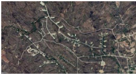
ဓာတ်ပုံ ပုံစာ, ကပစ စက်ရုံတွေ လည်ပတ်ဖို့ အနောက်နိုင်ငံတွေရဲ့ ကုမ္ပဏီတွေ ပါဝင်ပတ်သက်နေ

တချို့ အနေနဲ့ကတော့ သူတို့ရဲ့ မူလ မိခင် နိုင်ငံတွေရဲ့ နိုင်ငံရေး အပေါ် မူတည်ပြီး ကျွန်တော်တို့ကို တုံ့ပြန်ဖို့ရာ မဖြစ်နိုင်တဲ့ ကုမ္ပဏီတွေ ရှိနေတာကိုလည်း ကျွန်တော်တို့ အပြည့်အဝ နားလည် သဘောပေါက်ပါတယ်။ ကျွန်တော်တို့ဘက်ကတော့ ဆက်ပြီး ကြိုးစား နေမှာ ဖြစ်ပါတယ်။ မြန်မာ စစ်တပ်လက်ထဲ လက်နက်တွေ၊ လက်နက် ထုတ်လုပ်နိုင်ဖို့ လိုအပ်တဲ့ အရာတွေ ဘယ်လိုဘယ်ပုံ ရောက်ရှိနေလဲ ဆိုတာကို ပိုပြီး သိလာရဖို့၊ ဖော်ထုတ်နိုင်ဖို့ အင်မတန် လိုပါတယ်။