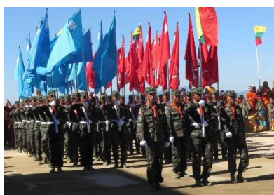
RCSS SSA troops.

The military regime has ordered an organising committee not to hold the 76th Shan National Day in Mong Pan Township, southern Shan State. The holiday that’s celebrated on 7 February has already been postponed for three years, mainly because of the pandemic.