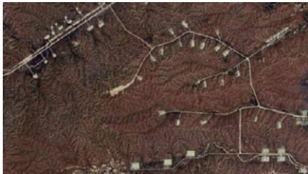
ဓာတ်ပုံ ပုံစာ, လက်နက်ထုတ်ရာ ကပစ စက်ရုံ ၂၅ နေရာကို SAC-M အစီရင်ခံစာထဲ ဖော်ပြ

ခရစ္စ ဆီဒိုတီ။ ။ ကျွန်တော်တို့ဟာ အစီရင်ခံစာကို အများသူငါကို မထုတ်ပြန်ခင်မှာ ကြိုတင်ပြီး သက်ဆိုင်ရာ ကုမ္ပဏီတွေထံ မိတ္တူတွေ ပို့ပါတယ်။ ကျွန်တော်တို့ တွေ့ရှိထားတဲ့ အချက်အလက်တွေကို ပြောပြပါတယ်။ မေးခွန်းတွေ မေးပါတယ်။