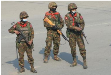
ဓာတ်ပုံ ပုံစာ၊ သေနတ်တွေကို မူလဒီဇိုင်းတွေကနေ ပုံစံတူ ဆင့်ပွားခွင့် လိုင်စင်ယူထားလား ဓာတ်ပုံ ရင်းမြစ်, GETTY IMAGES

ပိုပြီး ဆိုးနိုင်တာက၊ နောက်ဆုံး ဘယ်သူ့လက်ထဲ ရောက်သွားမလဲ ဆိုတာကို သိလျက်နဲ့ကို ရောင်းချတာမျိုးလား ဆိုတဲ့ မေးခွန်းပါပဲ။ မြန်မာ စစ်တပ်ထဲ ရောက်သွားဖို့ ရည်ရွယ်ချက်နဲ့ကို ကြားခံတွေ့ကနေ တဆင့် ရောင်းချတာ ဆိုရင်တော့ မြန်မာ စစ်တပ် ကျူးလွန်တဲ့ ပြင်းထန်ဆိုးရွားတဲ့ လူ့ အခွင့်အရေး ချိုးဖောက်မှုတွေမှာ အဲဒီ ကုမ္ပဏီတွေဟာ ကိုယ်တိုင် ကြံရာပါတော့ ဖြစ်နေပါတယ်။