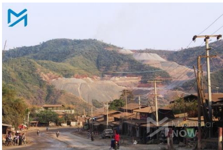
Jade mines seen on the outskirts of Hpakant in 2016

Several junta soldiers are believed to have been killed after fighting broke out in the Kachin State jade-mining town of Hpakant early Monday morning, according to local sources.