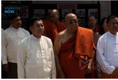
Ashin Nyanissara and Min Aung Hlaing at a ceremony in 2020

Interestingly, it was after Myanmar began to open up to the outside world just over a decade ago that Nyanissara’s preoccupation with Islam became more pronounced. Perhaps this was because the military-orchestrated transition to a quasi-democracy that started in 2010 didn’t just usher in limited political rights; it also showed signs of eroding respect for traditional power hierarchies, including that of the Buddhist monastic order.