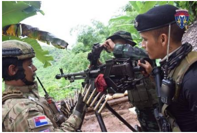
KNLA and resistance allies in Karen State

Resistance attacks on regime targets in Myanmar's southern, eastern and central regions are likely to increase in the coming months as the country's oldest rebel group has vowed to step up operations while saying fighting is only one way to end military rule.