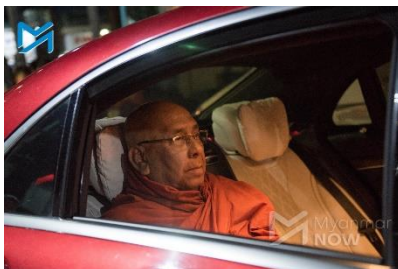
Ashin Nyanissara in 2019

After the election, Nyanissara echoed the military’s claims that there were doubts about the outcome, based on allegations that it had been rigged in favour of the NLD. Speaking to hundreds of his followers on November 16, 2020, he even made his own contribution to these unfounded conspiracy theories, claiming that a mysterious box containing 40,000 ballots had appeared out of nowhere at a polling station in Yangon.