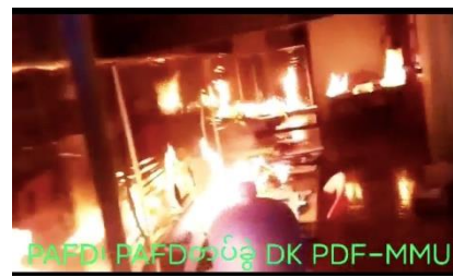
ဇန်နဝါရီ ၁၉ ရက်က တမူးမြို့ရှိ ရွေးကောက်ပွဲကော်မရှင်ရုံးကို တော်လှန်ရေးအင်အားစုများ တိုက်ခိုက်မီးရှို့

၎င်းတို့၏ ထုတ်ပြန်ချက်တွင် “အကြမ်းဖက် စစ်ကောင်စီမှ ကြီးမှူးကျင်းပသော အတုအယောင် ရွေးကောက်ပွဲ အောင်မြင် စေရန် ရည်ရွယ်၍ မြင်းမူမြို့ လ.ဝ.က ရုံးအတွင်း၌ ပြည်သူ့သစ္စာဖောက် လောက်ကောင် ဝန်ထမ်းများမှ ညအချိန်ထိ လျှို့ဝှက်စွာ မဲစာရင်းလုပ်နေကြစဉ် PAFD နှင့် PAFD တပ်ခွဲ DK PDF-MMU တပ်ဖွဲ့ဝင်များက မဲစာရင်းစာရွက်စာတမ်းများ၊ ကွန်ပျူတာများကို မီးရှို့ဖျက်ဆီးနိုင်ခဲ့ပါသည်။ ထိုစစ်ဆင်ရေးသည် အကြမ်းဖက်စစ်ကောင်စီ၏ အရန်အင်အားစု ဖြစ်သည့် မြို့နယ်မီးသတ်ရုံးနှင့် ကပ်လျက်တည်ရှိ၍ တော်လှန်ရေးရဲဘော်များက စနစ်တကျ အသေးစိတ် စီမံဆောင်ရွက်ခဲ့ရပါသည်။ လူပုဂ္ဂိုလ်အား တိုက်ခိုက်နေခြင်း မဟုတ်ဘဲ အာဏာရှင်စနစ်ကို တိုက်ဖျက်သည့် အဆုံးသတ်တိုက်ပွဲဖြစ်၍ တတ်နိုင်သမျှ လူပုဂ္ဂိုလ်များအား ငဲ့ညှာစွာ ဆောင်ရွက်ခဲ့ပါသည်” ဟုလည်း ဆိုထားသည်။