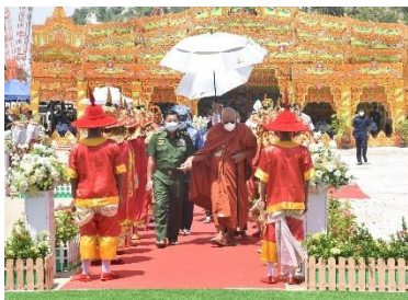
Min Aung Hlaing and Ashin Nyanissara attend an inauguration ceremony for a 17-metre-tall Buddha statue in Naypyitaw in 2020

Although he later distanced himself from Ma Ba Tha as it came to be dominated by more extreme figures like Wirathu—the monk who spearheaded the anti-Muslim 969 Movement—Nyanissara was clearly on board with its central message. He demonstrated this in July 2013, around six months before the group was formally established, when he addressed a major gathering of monks in Yangon and stoked their growing paranoia by speaking of how ancient Buddhist pagodas had been torn down in the city’s centre to make way for mosques.