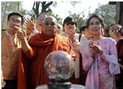
Ashin Nyanissara, second from left, and Aung San Suu Kyi, right, attend a ceremony marking the centennial anniversary of Suu Kyi's father, independence hero General Aung San, in February 2015

In a country where most other voices opposed to oppression had been silenced, these gentle rebukes were profoundly heartening to many. They offered psychological support to a nation that was under constant, crushing pressure to accept the unacceptable. And so, Nyanissara came to be seen, in a distinctly Buddhist way, as a sort of saviour figure, simply by virtue of his ability to remind Myanmar's people of the fundamental sanity of their demands for justice.