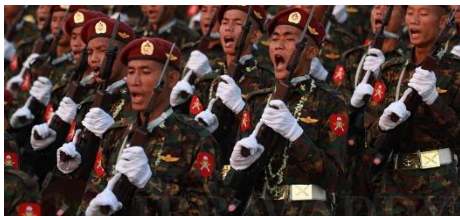
၂၀၁၈ ခုနှစ် နေပြည်တော်တွင် တပ်မတော်နေ့ စစ်ရေးပြအခမ်းအနားတွင် ပါဝင်သော စစ်သားများ

SAC-M ၏ အစီရင်ခံစာတွင် စင်ကာပူမှ ကုမ္ပဏီများသည် လက်နက်အရောင်းအဝယ်များတွင် ပွဲစားအဖြစ် ဆောင်ရွက်ပြီး ထိုပစ္စည်းများကို မြန်မာနိုင်ငံပိုင် လက်နက်ထုတ်လုပ်ရေး လုပ်ငန်းဖြစ်သည့် ကာကွယ်ရေး ပစ္စည်းထုတ်လုပ်မှု ညွှန်ကြားရေးမှူးရုံး (DDI) သို့ဖြစ်စေ ဟန်ပြအရပ်သား ကုမ္ပဏီများသို့ဖြစ်စေ တင်ပို့နေကြောင်း ဖော်ပြထားသည်။