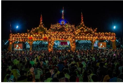
Thousands of Buddhists listening to Sitagu Sayadaw in Paleik, Myanmar in November 2017.

This earned him a brief period in exile. After he returned to the country, however, he seemed to get along better with the generals. But this wasn't particularly troubling to his devotees, as monks are generally expected to avoid overt involvement in politics, and to be open to engaging with even the worst elements of society. It wasn't until 2007, when the military carried out a merciless assault on monks taking part in the Saffron Revolution, that Nyanissara again became mildly critical of the country's self-appointed rulers.