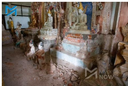
Buddha statues inside a religious building hit by a junta air strike in Letyetkone, in Sagaing Region’s Depayin Township, in September 2022

By continuing to back Min Aung Hlaing—even travelling with him to Russia last year for the opening of a Buddhist temple—Nyanissara has outraged many who once held him in the highest esteem. When, at an Armed Forces Day ceremony held less than two months after the coup, Myanmar’s new dictator seized on the monk’s praise to congratulate himself for his role in ridding Myanmar of “bad kalars”—using a derogatory term for people of Indian descent to refer to the Rohingya—it left an especially bitter taste in many people’s mouths. For it was on that day—March 27, 2021—that Min Aung Hlaing escalated his attacks on civilians opposed to his rule, killing hundreds around the country.