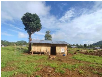
ဟိုပုံးစစ်ရှောင်

သျှမ်းပြည် တောင်ကြီးခရိုင် ဟိုပုံးမြို့နယ် နားပုံကျေးရွာအုပ်စု ဝမ်မိုင်ပန်လုံကျေးရွာသစ်ရှိ စစ်ရှောင်ဦးရေ ၆၀၀ ဝန်းကျင်မှာ ဘဝအသစ် ထူထောင်ရေးအတွက် အကူညီ လိုအပ်နေကြောင်း စုံစမ်းသိရှိရသည်။