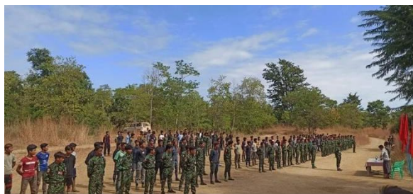
Resistance troops of Black Leopard People Army / BLPA

A heavy, nine-hour-long clash broke out in Pale Township, Sagaing Region on Wednesday when four PDF groups from Sagaing and Magwe regions conducted a surprise attack on regime forces at the Kan Daunt Police Station, said Black Leopard People Army, which coordinated the attack.