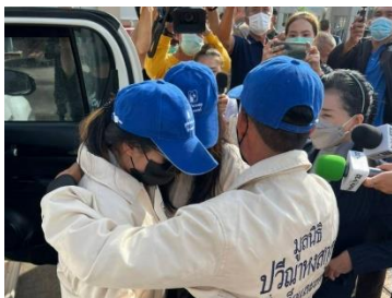
The rescued sisters hug their father after being reunited with him in Chiang Rai, Thailand, Nov. 27, 2022.

“Kokang connections to Chinese criminal networks also run deep. Chinese court records document hundreds of criminal convictions related to illegal casinos, fraud, kidnapping, drugs and weapons in the Kokang SAZ.”