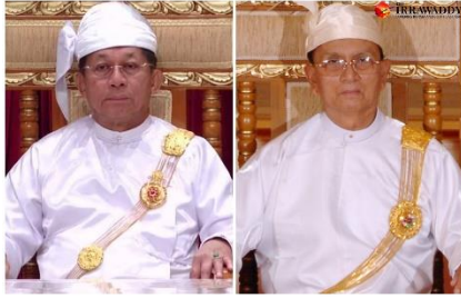
Junta chief Min Aung Hlaing (left) in January 2023, and military proxy president U Thein Sein (right) after his swearing-in ceremony in March 2011.

During the grand military reviews and ceremonies to confer titles, he has worn the Salwel , a sash that is one of the regalia of the Myanmar president, mimicking the pose of Thein Sein when the latter was sworn in as president at the Parliament in 2011.