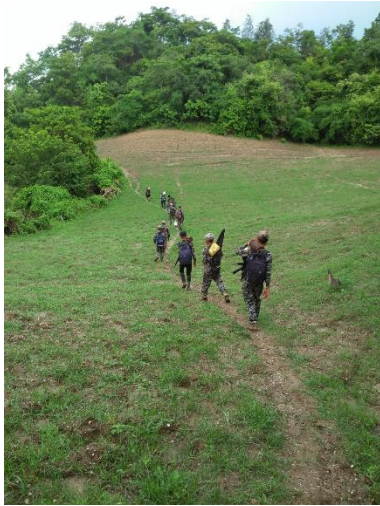
Fighters of Kyauklongyi PDF during an operation in Kani Township

Six junta soldiers were killed in Kani Township, Sagaing Region on Wednesday when three PDF groups ambushed a scout motorboat carrying seven soldiers on the Chindwin River, said Kyauklonegyi PDF, which coordinated the attack.