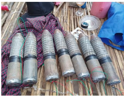
Improvised-artillery rounds of Lin Yone Ni PDF force in Kanbalu Township

At least three regime forces were killed and some others injured in Kanbalu Township, Sagaing Region on Thursday when five PDF groups jointly raided regime forces and pro-regime Pyu Saw Htee militia members stationed at Yaw Village, said local PDF group Kanbalu Underground Warriors,