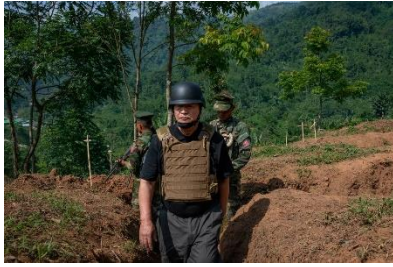
NUG ယာယီသမ္မတ ဒူဝါ လရီးလ

အာရုံစိုက်မိသော်လည်း မဟာမိတ်ကော်မတီသည် လူမျိုးစု နိုင်ငံရေးနှင့် လက်နက်ကိုင် အင်အားစုများနှင့် ထိတွေ့ဆက်ဆံရာတွင် အရေးပါသော အခြေခံ အဖွဲ့အစည်းများအနက် တခုဖြစ်သည်။