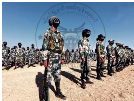
Resistance fighters of Myaung Revolution Army in Myaung Township

Many regime forces are believed to have been killed or injured in Myaung Township, Sagaing Region on Sunday night when six PDF groups simultaneously raided four regime bases including a police station, junta controlled-township General Administration Department offices and housing for junta servants in the town, said Myaung Revolution Army,