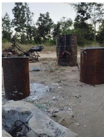
Improvised land mines made by Myaing-PDF from fuel tanks.

Many regime forces including pro-regime Pyu Saw Htee militia members are believed to have been killed or injured in Myaing Township, Magwe Region on Saturday when Myaing-PDF used several land mines, including heavy ones, to ambush a junta vehicle from a pro-regime village, the PDF group said.