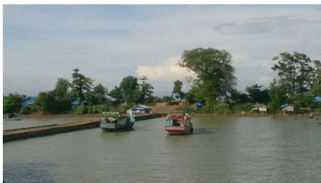
ဓာတ်ပုံ ပုံစာ, ရသေ့တောင် အငူမော်ဆိပ်ကမ်း

ပြီးခဲ့တဲ့ ၂၀၁၉ ခုနှစ်အတွင်းကလည်း ရခိုင်ပြည်နယ်အတွင်း တိုက်ပွဲတွေပြင်းထန်နေတဲ့အချိန် မြောက်ဦး၊ ကျောက်တော်နဲ့ ရသေ့တောင်မြို့နယ်တွေက ကျေးရွာရပ်ကွက်အုပ်ချုပ်ရေးမှူးတွေ အများအပြားနုတ်ထွက်ခဲ့ကြတာတွေလည်း ရှိခဲ့ဖူးပါတယ်။