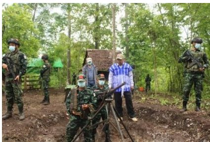
NUG ပြည်ထောင်စုဝန်ကြီးချုပ် မန်းဝင်းခိုင်သန်း PDF စခန်းများသို့ ဇွန်လ ၇ ရက်က သွားရောက်ခဲ့စဉ် / NUG

ထိုသို့သော အောင်မြင်မှုများရှိသော်လည်း တွေ့ဆုံဆွေးနွေးမှုလမ်းကြောင်း အထူးသဖြင့် NUCC သည် ထိရောက်မှုမရှိဘဲ နှေးကွေးကာ အုပ်စုနိုင်ငံရေး၊ သမိုင်းဆိုင်ရာ ထိခိုက်နစ်နာမှုများနှင့် ယုံကြည်မှုကင်းမဲ့ခြင်းများ ဖြစ်နေသည်ဟု ကျယ်ကျယ်ပြန့်ပြန့် မြင်ကြသည်။ FDC တွင် တည်ငြိမ်ရေးအတွက် လမ်းပြမြေပုံကို ဖော်ပြထားသော်လည်း NUCC ပြင်ပမှ ကျယ်ပြန့်သော ထောက်ခံမှု ကင်းမဲ့နေသည်ဟု မြင်ကြသည်။