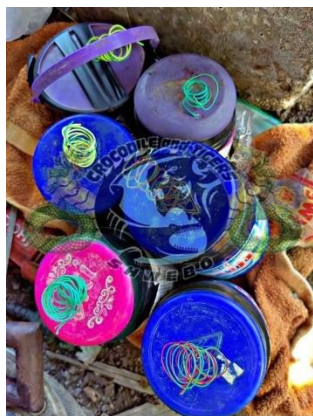
Improvised bombs made by C&T Shwebo PDF

A pro-regime Pyu Saw Htee militia member was killed and another injured in Shwebo Township, Sagaing Region on Monday when local PDF group C&T Shwebo used remote-controlled parcel bombs to attack militia members in two pro-regime villages in the township, the resistance group said.