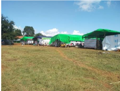
ကျောက်မဲစစ်ရှောင်စခန်း

သျှမ်းပြည်မြောက်ပိုင်း ကျောက်မဲမြို့ သျှမ်းစာပေ နှင့် ယဉ်ကျေးမှုကျောင်းအတွင်းရှိ စစ်ဘေးရှောင်များ စစ်ကောင်စီမှ နေရပ်ပြန်ရန် ထပ်မံဖိအားပေးပြီးနောက် စစ်ရှောင်များသည် မြို့ပေါ်သို့ အိမ်ငှားနေထိုင်ရန် ဆုံးဖြတ်ခဲ့ကြောင်း စုံစမ်းသိရှိရသည်။