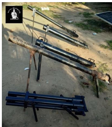
Improvised mortar shells made by Black God Guerrilla Force in Magwe Region

Many regime troops are believed to have been killed or injured in Myaing Township, Magwe Region on Sunday when around 10 local PDF groups jointly attacked a military camp in the west of the township, claimed Black God Guerrilla Forces, which was involved in the attack.