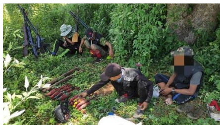
PDF fighters of Burma Rangers Force during an operation in Shwebo Township.

Local PDF group Burma Rangers claimed it used two grenades to attack regime forces stationed in the compound of AYA Bank in the town of Shwebo, Sagaing Region on Monday evening.