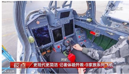
FTC 2000G (JL-9) တိုက်လေယာဉ် အမောင်းသင်စက်

လက်ရှိအချိန်မှာ တနိုင်ငံလုံးအနှံ့ စစ်ဆင်ရေးဝင်နေရတဲ့ စစ်ကောင်စီလေတပ်အတွက် ဒီလေယာဉ်တွေဟာ ကျောင်းဆင်း စ လေသူရဲများကို လေ့ကျင့်ပေးရာမှာရော အပေါ့စားတိုက်ခိုက်ရေးနဲ့ လေကြောင်းပစ်ကူ ပေးအပ်ရာမှာရော အဖိုးနည်းဝန်ပါ အလွန်အသုံးဝင်မယ့်တိုက်လေယာဉ်များဖြစ်ပါတယ်။