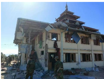
Koong Sar temple.

Six days of fighting between the regime and the Ta'ang National Liberation Army (TNLA) have destroyed almost all the houses in a frontline village in Namhsan Township, northern Shan State.