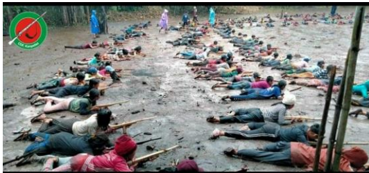
A female member of CDF-Kanpetlet undergoes basic military training.

The men and women who join the PDFs are considered to be soldiers of the people and are ready to give their lives for the revolution, but they also need weapons and ammunition, added the TGR leader. She asked Myanmar people at home and abroad to make donations so that weapons can be bought for the resistance forces.