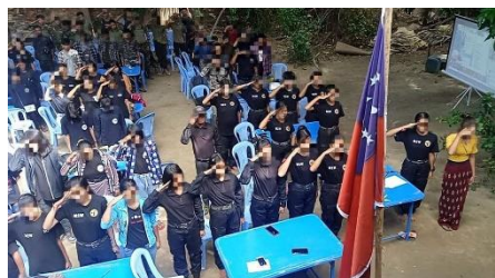
Comrades from Myaung Women Warriors.

Myaung Women Warriors (M2W), famous for its landmine attacks against junta troops in Sagaing Region, was formed by female civilians from Sagaing's Myaung Township in order to eradicate the fascist dictatorship, as well as to show that women can be involved in the revolution and to promote the role of females, according to Amara Hmuae, the spokesperson for M2W.