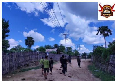
Myaing-PDF resistance fighters during an operation.

Six pro-regime Pyu Saw Htee militia members were killed in Myaing Township, Magwe Region early on Saturday morning when four local PDF groups attacked 10 militia members stealing the nut harvest from the farms of displaced villagers near pro-regime Thayat Kan Village, said Myaing-PDF, which