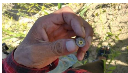
A bullet found near the alleged murder site on November 4

“All we could find were my husband’s hat and shoes on a blood stain on the ground,” said Hla Saung’s wife.