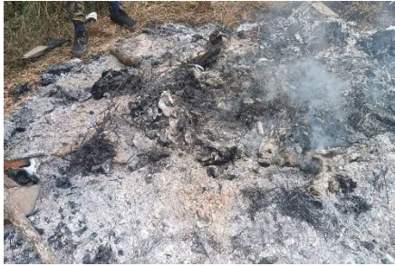
The charred remains of the victims in Pa Lon Twi seen on November 11

Junta soldiers reportedly disguised as resistance fighters arrived in the community unannounced on November 7, occupying it until the early hours of November 10, after which the bodies were found by members of the CDF.