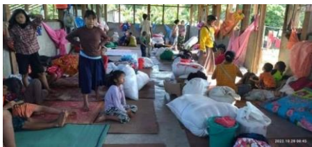
မိုးမောက်စစ်ရှောင်

ကချင်ပြည် မိုးမောက်မြို့ လောကမာရဇိန်ကျောင်းတိုက် စစ်ရှောင်စခန်းတွင် လက်နက်ကြီးတစ်လုံး ကျရောက်ပေါက်ကွဲခဲ့မှုကြောင့် စစ်ရှောင်များ နေရာသစ်တို့ ထပ်မံပြောင်းရွှေ့ခဲ့ရကြောင်း စုံစမ်းသိရှိရသည်။