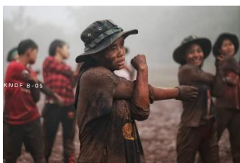
Members of KNDF Battalion 5's all-female unit seen during military training.

The women participating in the revolution will keep fighting the junta until it is gone and they want the public to believe in the resistance fighters.