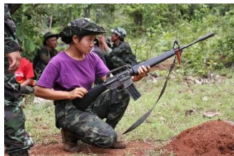
A member of KNDF Battalion 5's all-female unit seen during weapons training.

The KNDF Battalion 5 women's unit was formed in May 2021 with dozens of members. The KNDF was the first EAO to form a female force after the coup.