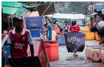
A member of Yangon Revolution Force holds open his longyi to read ‘We will win’ at a market on November 13 in Yangon

Amid tight security in Yangon, members of the anti-regime resistance group Yangon Revolution Force (YRF) staged flash mob-style solo protests across the city on November 13 by briefly displaying anti-dictatorship slogans printed in paint on the inside layer of their folded longyi. The YRF said in a statement later that day that the “performances” reflected the sentiments of the general public who are prohibited from expressing opposition to the junta. The youth performances, which were photographed, attracted attention because of the creativity and risk involved as the military continues to respond to dissent with violence.