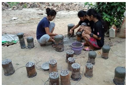
Members of Myaung Women Warriors prepare landmines.

She and the other members of M2W took part in military training and learned the techniques of making landmines before the all-women force was formed. Leaders from the Civilians Defense and Security Organization Myaung shared the techniques of making landmines that they had learned from the Kachin Independence Army (KIA). M2W fighters have been involved in mine attacks against regime forces since October 30, 2021.