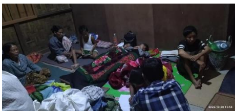
မိုးမောက်စစ်ရှောင်

“ လက်နက်ကြီးကျပေါက်ကွဲတာ ကျနော်တို့ ကျောင်းတိုက်နဲ့ မီးဓာတ်တိုက် ၃ တိုင်လောက်ပဲ ဝေးတယ်။ အမျိုးသားတစ်ဦးလည်း ထိခိုက်ဒဏ်ရာရသွားတယ်။ ခြေထောက်နှစ်ဖက်နဲ့ ပုခုံးက လက်နက်ကြီး ကျည်စထိ သွားတယ်။ ပြည်သူနေအိမ် ၂ လုံးလည်း မီးလောင်သွားတယ်။ အခုကျောင်းတိုက်မှာ စစ်ရှောင်တွေခိုလှုံဖို့ မလုံခြုံတော့ သျှမ်းစာပေယဉ်ကျေးမှုကျောင်း နဲ့ နေရပ်အိမ်မှာ ပြန်သွားနေရတယ် “ ဟု ၎င်းကော်မတီဝင် တစ်ဦးကပြောသည်။