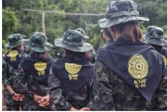
Comrades from KNDF Battalion 5's all-female unit. / KNDF-B-05

The men and women who join the PDFs are considered to be soldiers of the people and are ready to give their lives for the revolution, but they also need weapons and ammunition, added the TGR leader. She asked Myanmar people at home and abroad to make donations so that weapons can be bought for the resistance forces.