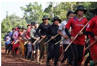
Members of KNDF Battalion 5's all-female unit seen during military training. / KNDF-B-05

Its members are women from various sectors and they spent a month training with the drones. TGR has two drones each worth almost US$5,000 and use bombs made by the Myaung People Defense Force.