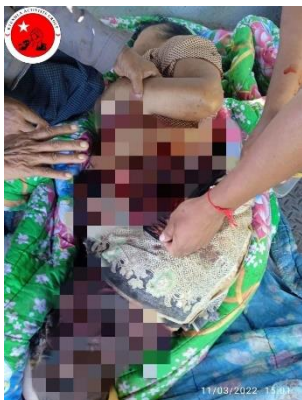
Daw Win, 68, killed in a Myanmar army shelling of Zee Ka Nar village in Kanbalu Township on November 3

Around 150 soldiers from the nearby city of Monywa—where the Northwestern Military Command is located—arrived in southern Budalin Township on November 2, and proceeded to raid multiple villages in that area.