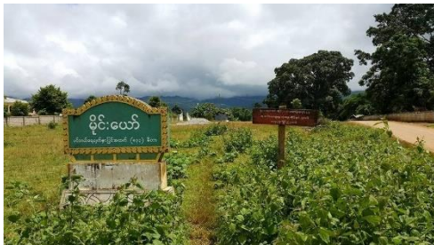
မိုင်းယော်တိုက်နယ်

သျှမ်းပြည်မြောက်ပိုင်း လားရှိုးမြို့နယ် မိုင်းယော်တိုက်နယ်အတွင်းတွင် စစ်ရေးတင်းမာမှုများ ဆက်လက်ရှိနေသေးသဖြင့် ဒေသခံများလယ်ယာမသွားနိုင်သေးကြောင်း သတင်းသိရသည်။