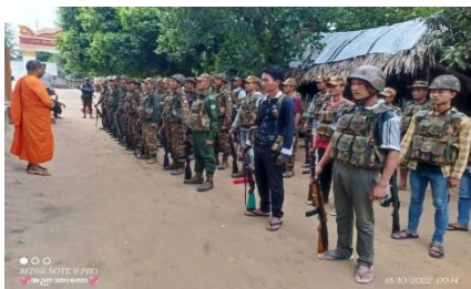
A Pyu Saw Htee training exercise is held in Sagaing Region in October

Three men were killed after a local anti-junta resistance group launched an attack on seven alleged members of the military-backed Pyu Saw Htee militia in Yangon's Twantay Township on Saturday.