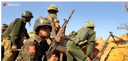
KIA တပ်ဖွဲ့ဝင်များ

သို့ဖြစ်ရာ ကချင်ပြည်နယ်တဝှမ်း စစ်ကောင်စီတပ်များ (မပခ တိုင်းတပ် ၃၇ ရင်း၊ တပ်မ/စကခ ၃၈ ရင်း စုစုပေါင်း ၇၅ ရင်းနှင့် အမြောက်တပ်ရင်းများ၊ လက်ရုံးတပ်များ)၊ နယ်ခြားစောင့် BGF ၃ ရင်းနှင့် ပြည်သူ့စစ်များ ဖြန့်ခွဲ အခြေပြုထားသကဲ့သို့ KIA ကလည်း တပ်မဟာ ၇ ခု၊ လှုပ်ရှား တပ်မ ၂ ခု၊ လက်နက်ကြီးတပ်မ တခုတို့ဖြင့် ဖြန့်ခွဲရင်ဆိုင်ထားသည်။