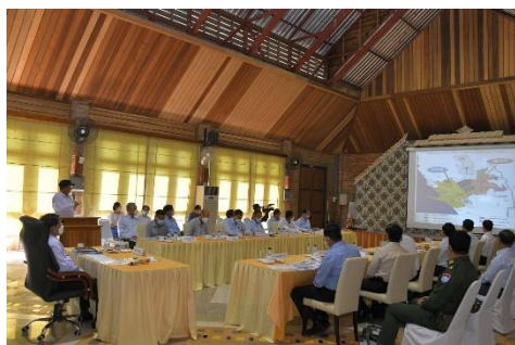
Min Aung Hlaing (seated at far left) attends a meeting about the Dawei SEZ on November 4

Myanmar’s junta chief Min Aung Hlaing visited the towns of Dawei and Myeik in southern Myanmar’s Tanintharyi Region last week to meet with local businesspeople and inspect the site of a long-delayed Special Economic Zone (SEZ), state media reported.