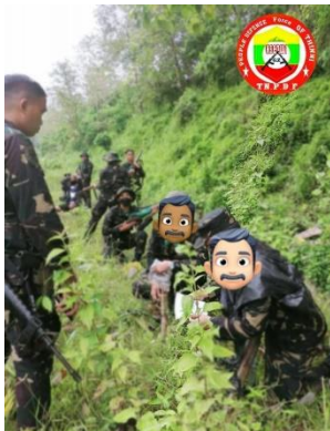
TNPDF (ပုံအဟောင်း)

သျှမ်းပြည်မြောက်ပိုင်း သိန္နီမြို့နယ် သိန္နီ - ဟိုပန် လမ်းကြားတွင် သိန္နီပြည်သူ့ ကာကွယ်ရေးတပ်ဖွဲ့ PDF နှင့် အာဏာသိမ်း စစ်ကောင်စီတို့ တိုက်ပွဲဖြစ်ပွားခဲ့ပြီး PDF ဘက်မှ ၇ ဦး ကျဆုံးခဲ့ကြောင်း သတင်းသိရသည်။