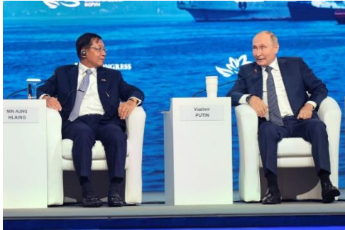
မြန်မာ စစ်ကောင်စီခေါင်းဆောင် မင်းအောင်လှိုင်နှင့် ရုရှား အာဏာရှင် ပူတင်

မြန်မာပြည်က စစ်ခေါင်းဆောင်တွေဆိုရင် အမျိုးဘာသာ ဆိုတာနဲ့ ကိုယ့်ကိုယ်ကိုယ် ချမ်းသာအောင်လုပ်ဖို့ အာဏာလက်မလွှတ်ရဖို့က လွဲရင် ဘာနိုင်ငံရေးအတွေးအခေါ်မှ မရှိဘူး။ အီရန်က ခေါင်းဆောင်တွေ ဆိုရင်လည်း အနောက်မိစ္ဆာအုပ်စုက ဝေဖန်တယ်ဆိုတာမျိုးနဲ့ အရေးကို မလုပ်တော့ပါဘူး။ ကျူးဘားနဲ့ ဗင်နီဇွဲလားတို့ဆိုရင်လည်း ပြည်ပကလာတဲ့ ထုတ်ပြန်ချက်မှန်သမျှကို ကိုလိုနီလက်သစ်တွေဆိုပြီး ပယ်ထားလိုက်တာပဲ။