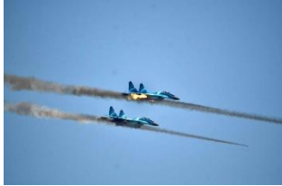
Junta fighter jets.