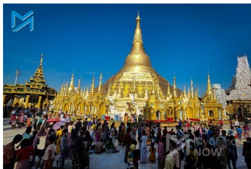
Visitors are seen at Shwedagon Pagoda on November 7

The next day, junta forces on patrol in three vehicles were attacked with explosives at a street junction in Aungmyay Thazan Township in an early morning ambush. Two vehicles sustained damage and at least one police officer was killed, local residents said.