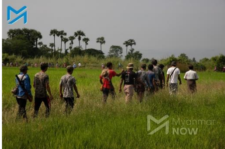
Local defence team members in Sagaing Region in October

Soldiers stationed in the Kanbalu village of Koe Taung Boet fired shells at neighbouring Zee Ka Nar on November 3 after anti-junta defence forces ambushed 50 advancing Myanmar army troops, according to a local.