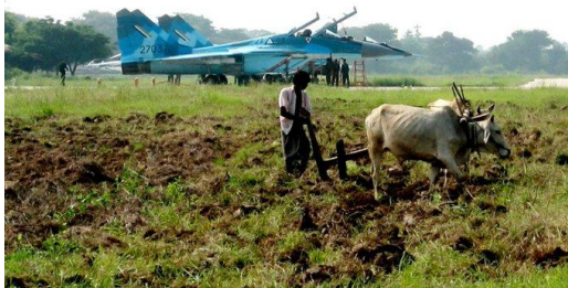
မြန်မာလေတပ်ပိုင် MIG 29 တိုက်လေယာဉ်

ထို့ပြင် ခေတ်မှီစစ်လက်နက်များ ပေါ်ပေါက်လာသောအခါ နည်းပညာ လျှို့ဝှက်ချက်အရ၊ ငွေကြေးဓန တတ်နိုင်စွမ်းအရ စစ်လက်နက်ပိုင်ဆိုင် အသုံးပြုနိုင်စွမ်းလည်း ကွာခြားလာသည်ကို တွေ့မြင်ရသည်။ သို့ဖြစ်ရာ လူသားမျိုးနွယ်များ၏ တိုက်ပွဲများ၊ စစ်ပွဲများတွင်လည်း စစ်လက်နက် အသုံးပြုနိုင်စွမ်း ကွာခြားသည့် စစ်ပွဲများစွာ ကြုံတွေ့လာရ၏။