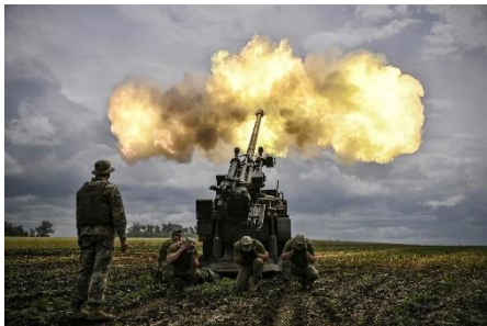
ဇွန်လ ၁၅ ရက်နေ့က ယူကရိန်း အရှေ့ဘက် ဒွန်ဘတ်စ် ရှေ့တန်းမှ ရုရှားဘက်သို့ ယူကရိန်း စစ်တပ်က ဟောင်ဝစ်ဇာအမြောက်ဖြင့် ပစ်ခတ်နေစဉ်

သူတို့တောင်းဆိုနေတာတွေ၊ သူတို့နဲ့အတူ ဝင်ပြီး ရပ်တည်တောင်းဆိုပေးတဲ့ စက်ရုံအလုပ်သမားတွေကို အီရန်အစိုးရက နှိပ်ကွပ်တယ်။ ဖမ်းဆီးတယ်။ ကိုယ်ထိလက်ရောက် နှိပ်စက်တယ်။ အီရန် အမျိုးသမီးငယ်တဦးဆိုရင် တော်လှန်ရေးသီချင်းကိုဆိုလို့ အသတ်တောင်ခံခဲ့ရတယ်။ ရုရှားတွေကလည်း ယူကရိန်းတွေကို ယူကရိန်းသီချင်းမဆိုဖို့ တားမြစ်ထားကြတယ်။ အဲဒီအစိုးရတွေဟာ ဒီလိုနည်းပေါင်းစုံကို သုံးနေကြတယ်။