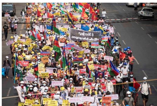
Ethnic people stage a protest against military rule in Yangon in February 2021.

Such a misconception by foreign diplomats, leaders or UN officials is an insult to young ethnic people who have formed or joined People’s Defense Force groups (commonly known as PDFs) in their states since the coup last year, and the older ethnic armed organizations that have supported or joined the Spring Revolution together with the PDFs.