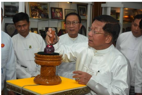
Min Aung Hlaing inspects the Na Sa Ka ruby in July 2022.

“If there is no security, well-off people will have to do the night watch bearing their belongings,” was what Min Aung Hlaing told his junta ministers at the same cabinet meeting on Tuesday as he highlighted the importance of law and order, and rule of law. Apparently, he is not aware of just how lawless Myanmar has become since