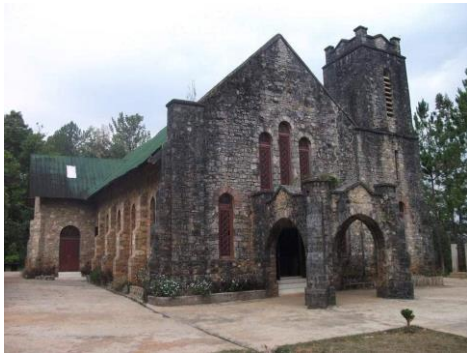
ဓမ္မကျမ်းစာကျောင်း

သျှမ်းပြည်မြောက်ပိုင်း ကွတ်ခိုင်မြို့နယ် ဓမ္မကျမ်းစာကျောင်းအနီး လက်နက်ကြီး ကျရောက်ပေါက်ကွဲမှုကြောင့် ကျောင်းသား ၄ ဦး ထိခိုက်ဒဏ်ရာရသွားကြောင်း သတင်းသိရသည်။