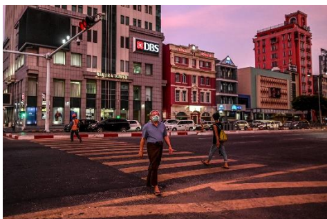
Pedestrians cross a road on a walkway in the downtown area of Yangon on May 15, 2020.

The law prohibits organizations from supporting or otherwise having direct or indirect links with groups and individuals that the regime has labeled terrorists or that actively oppose the regime, as well as with unlawful associations and their members.