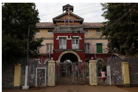
Insein Prison, seen in late December 2017

Maung Shwe Wah | Published on Nov 4, 2022