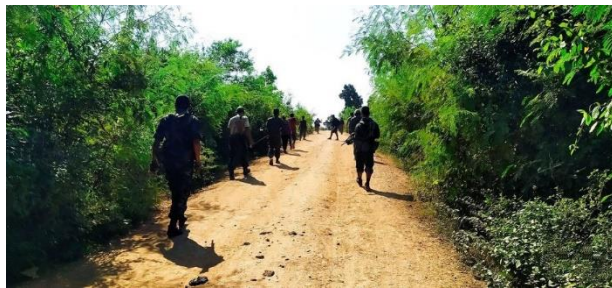
Resistance fighters of Taze-PDF during an operation.

Local resistance group Taze-PDF claimed to have attacked regime forces stationed at a petrol station in Taze Township, Sagaing Region using six improvised mortar shells on Thursday morning.