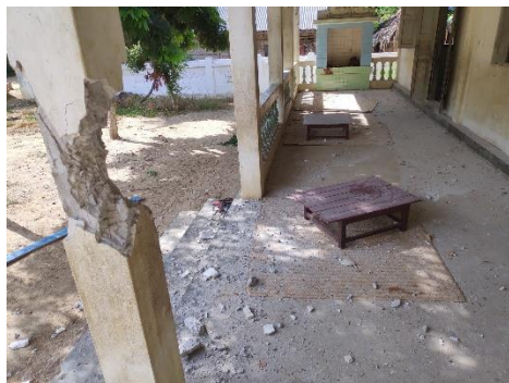
A destroyed school building

Over the past 20 months since military chief Min Aung Hlaing staged a coup on Feb. 1, 2021, the junta has been brutally crushing all anti-regime opponents and resistance forces without sparing the lives of innocent children across the country.