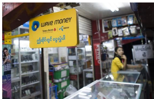
A shop owner advertises the Wave Money mobile banking service.

Resistance fighters say ramped-up financial surveillance has made it harder to fund their struggle, as new central bank rules separate ordinary people and business owners from their money.