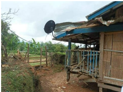
လက်နက်ကြီးထိမှန်တဲ့နေအိမ်

သျှမ်းပြည် မြောက်ပိုင်း သီပေါမြို့နယ် နမ့်စလပ်ကျေးရွာအုပ်စု အတွင်း လက်နက်ကြီး ကျပေါက်ကွဲမှုကြောင့် အရပ်သား ပြည်သူတစ်ဦးသေဆုံးပြီး ထိခိုက်ဒဏ်ရာရသူများလည်း ရှိနေကြောင်း သတင်းသိရသည်။