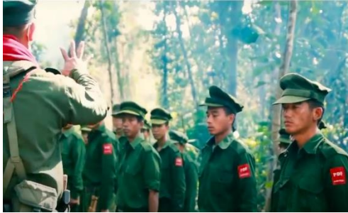
Members of the anti-junta People's Defence Force in Kachin State (Putao PDF)

A Myanmar army column triggered explosives set up by anti-junta resistance forces in Sagaing Region's Katha Township on Tuesday before retaliating and abducting six area civilians.