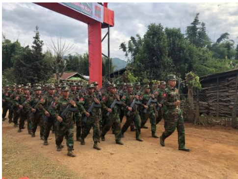
TNLA soldiers parade at a Ta’ang National Revolution Day celebration in northern Shan State’s Tangyan Township in January.

After three weeks of arrest, on June 29, the SSPP freed the men after village elders signed contracts for their release in which they pledged that the men were not guilty of any crime.