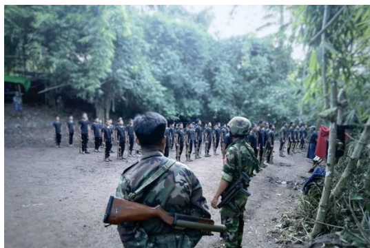
Fighters of Banmauk-PDF undergo military training. / Banmauk Revolution

A series of intense firefights—which have prompted the junta to call in air strikes—have been going on between regime forces and combined forces of the Kachin Independence Army (KIA) and allied PDF groups in Banmauk Township, Sagaing Region since Tuesday, said Banmauk Revolution (BR), the media