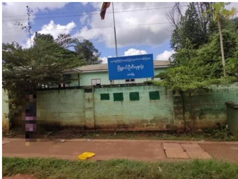
နမ့်စန် မှတ်ပုံတင်

သျှမ်းပြည်တောင်ပိုင်း နမ့်စန်မြို့နယ် မြို့နယ်ဦးစီးမှူးရုံးတွင် ယခုလတွင်း မှတ်ပုံတင်သွားလုပ်ကြသူများကို ဦးစီးမှူးက တစ်ယောက်ကို ကျပ် (၂) သိန်းဆီတောင်းယူနေကြောင်း စုံစမ်းသိရှိရသည်။