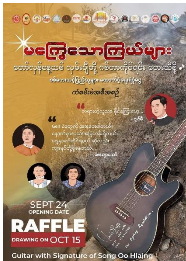
A poster for charity raffle.