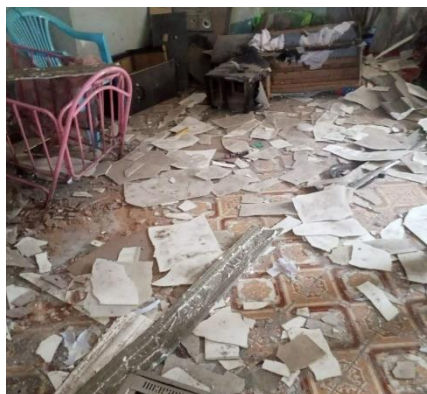
A civilians house damaged by shelling

BA fired artillery in all directions and there were casualties on both sides, but the number wasn't known at the time of reporting.