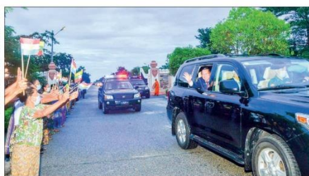
Prime Minister Senior General Min Aung Hlaing who uplifted prestige of Myanmar throughout the world and party tumultuously welcomed back by the people at the military airport in Nay Pyi Taw on 11 September.

THE Myanmar high-level delegation members led by Chairman of the State Administration Council Prime Minister Senior General Min Aung Hlaing left Irkutsk of the Russian Federation by special flight of Myanmar Airways International yesterday afternoon local standard time for the Republic of the Union of Myanmar. They were sent off at the airport by Head of Government of Irkutsk State Mr Igor Ivanov, Governor and party Myanmar Ambassador to Russia U Lwin On, Military Attache Brig Gen Moe Kywe and officials. Council members U Minsang Har and U Saw Thant, Council Joint-Secretary Lt Gen Ye Win On, Union Minister for Planning and Finance U Win Shwe, Union Minister for Investment and Foreign Economic Relations Dr Han Zaw, Union Minister for Cooperatives and Rural Development U Hla Aye, Union Minister for