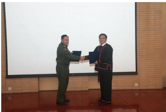
ပုံ - ရရှိခဲ့ကြတဲ့ သဘောတူညီမှုကို လက်မှတ်ရေးထိုးပြီး လဲလှယ်နေကြစဉ်

ထိုတွေ့ဆုံမှုတွင် ၂၀၁၈ ဖွဲ့စည်းပုံ အခြေခံဥပဒေကိစ္စ၊ ငြိမ်းချမ်းရေးကိစ္စ၊ ပြည်ထောင်စု ကိစ္စရပ်များအပြင် NCA အကောင်အထည် ဖော်မှုဆိုင်ရာ ကိစ္စရပ်များကို ဆွေးနွေးခဲ့ကြသည်။ ဆွေးနွေးပွဲတွင် သဘောတူညီမှု အချို့ကို လက်မှတ်ရေး ထိုးခဲ့ကြသော်လည်း နှစ်ဖက်အဖွဲ့အစည်းများအနေဖြင့် သဘောတူညီမှုများနှင့် ပတ်သက်၍ တစ်စုံတစ်ရာ ထုတ်ပြန်ခဲ့ခြင်း မရှိပေ။