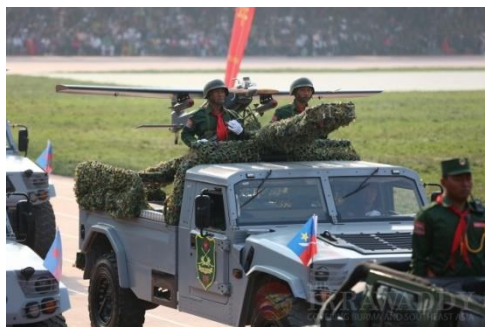
A UWSA parade in April 2019 to mark the 30th anniversary of its ceasefire with Myanmar's government.