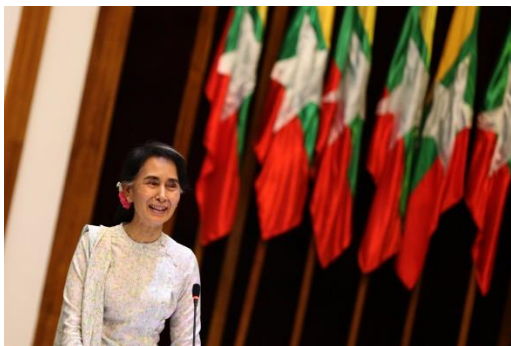
Daw Aung San Suu Kyi as the State Counselor in 2016.

In his latest comments on his arrest of Myanmar democracy leader Daw Aung San Suu Kyi, regime leader Min Aung Hlaing told Russian news agency RIA that no further decisions will be taken regarding the detained State Counselor until all her legal trials are complete.