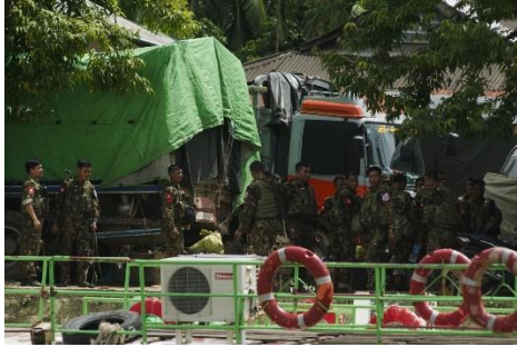
Several junta soldiers seen near the Buthidaung port in August 2017

The Mee Taik village base, located near Milestone 37 of the Myanmar-Bangladesh border fence and two miles east of Taungpyo town, was seized by the AA in an intense 20-minute exchange of fire, according to a source close to the ethnic armed organisation.