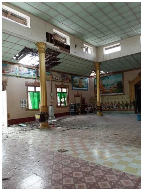
Mwe Taw temple after being hit by a junta shell on Friday.

Since clashes re-erupted in Moebye on September 8, at least five people have been killed and more than 20 injured. A seven-year-old was killed when a shell hit Ave Mater Dei Catholic church in Moebye.