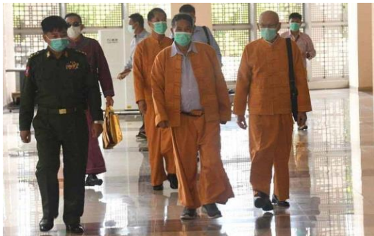
ပုံ - ပထမအကြိမ် တွေ့ဆုံဆွေးနွေးပွဲသို့ တက်ရောက်လာသည့် SSPP ခေါင်းဆောင်များ

ပထမအကြိမ် တွေ့ဆုံဆွေးနွေးပွဲကို NCA လက်မှတ်ရေးထိုးထားသည့် တိုင်းရင်းသား လက်နက်ကိုင် အဖွဲ့အစည်း ၇ ဖွဲ့ဖြစ်သည့် ရှမ်းပြည် ပြန်လည်ထူထောင်ရေး ကောင်စီ RCSS၊ မွန်ပြည်သစ်ပါတီ NMSP၊ ရခိုင်ပြည်လွတ်မြောက်ရေးပါတီ ALP၊ လားဟူ ဒီမိုကရက်တစ် အစည်းအရုံး LDU၊ ပအိုဝ်း အမျိုးသား လွတ်မြောက်ရေး အဖွဲ့ချုပ် PNLO၊ ဒီမိုကရေစီ အကျိုးပြု ကရင်တပ် မတော် DKBA၊ ကရင်ငြိမ်းချမ်းရေးကောင်စီ KNU/KNLA /PC စသည့် အဖွဲ့များနှင့် တွေ့ဆုံဆွေးနွေး ခဲ့သကဲ့သို့ လက်မှတ်ရေးထိုးထားသည့် တရုတ်-မြန်မာနယ်စပ်က တိုင်းရင်းသား လက်နက် ကိုင် အဖွဲ့အစည်းအချို့ ဖြစ်သည့် “ဝ” ပြည်သွေးစည်းညီညွတ်ရေးပါတီ UWSP/UWSA၊ မိုင်းလား NDAA၊ ရှမ်းပြန်တိုးတက်ရေးပါတီ SSPP တို့လည်း တက်ရောက်တွေ့ဆုံဆွေးနွေးခဲ့ကြသည်။