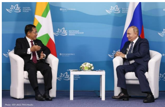
Min Aung Hlaing and Putin at the Eastern Economic Forum-2022 in Vladivostok on Sept. 9.

With the Myanmar military regime growing increasingly reliant on Russia, including militarily, regime leader Min Aung Hlaing said there are opportunities and prospects for cooperation when asked by the Russian RIA news agency about the possibility of Russian troop deployments in