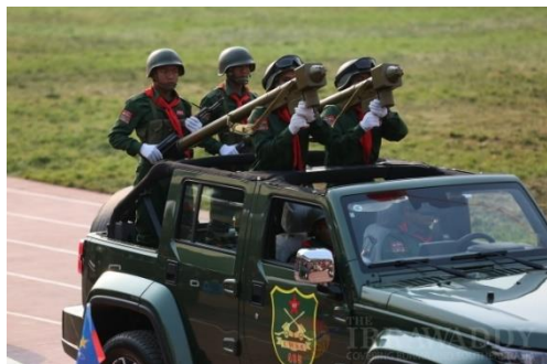
A UWSA parade in April 2019 to mark the 30th anniversary of its ceasefire with Myanmar's government.

As the AA leadership is also young, there can be closer cooperation. The UWSA sees the AA as important, partly because it could offer access to the Indian Ocean."