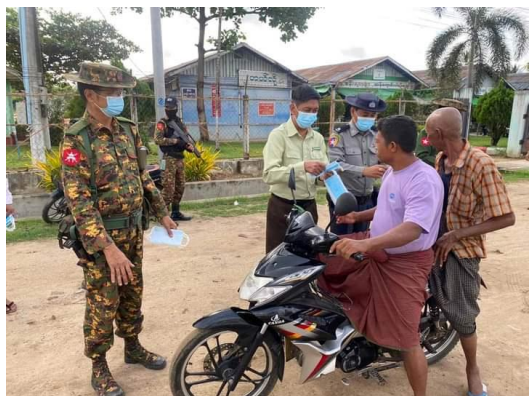
A COVID-19 awareness campaign in Naypyitaw on Sept. 16.

Just a few days after Min Aung Hlaing told Russia's RIA news agency that COVID-19 was under control in Myanmar, a surge in cases was reported with fatalities.