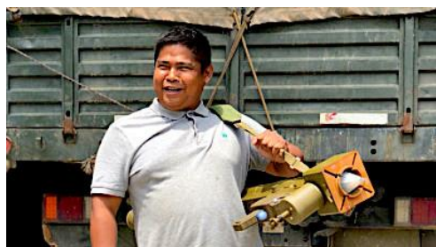
Arakan Army deputy commander-in-chief Brigadier General Nyo Tun Aung.

Brig-Gen Nyo Tun Aung, 41, traveled from the Kachin Independence Army (KIA) headquarters in Laiza to Mongla to meet the UWSA's new deputy leader, Bao Ai Chan, also known as Bao Junping, 41.