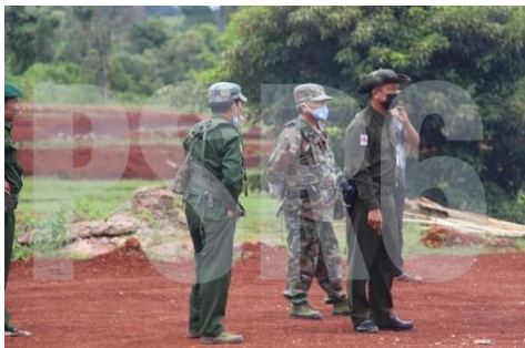
PNO တပ်သားများ

သျှမ်းပြည်တောင်ပိုင်း ပင်လောင်းမြို့နယ် နှင့် ညောင်ရွှေမြို့နယ်ရှိ ကျေးရွာများတွင် ပအိုဝ်းပြည်သူ့စစ် (PNA) တပ်ဖွဲ့က ကြံ့ခိုင်ရေးပါတီကို မဲပေးရန် ဖိအားပေးပြီး စာရင်းများလည်း ကောက်ခံနေကြောင်း စုံစမ်းသိရှိရသည်။