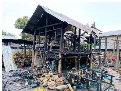
A burned-out house in Moebye after junta forces bombed the town on September 11.

An eight-year-old child was killed in the junta bombardment and some 100 houses and buildings were destroyed, said the Progressive Karenni People's Force, a Karenni rights group documenting human rights violations in southeast Myanmar's Kayah State and neighboring townships in southern Shan State.