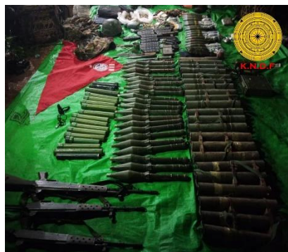
Weapons and ammunition seized by Karenni resistance forces in Moebye on September 11.

KNDF released photos of dead junta soldiers and captured weapons and ammunition.