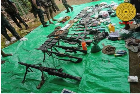
Weapons and ammunition seized following clashes in Moebye on September 8

The body of the child, whose identity could not be confirmed at the time of reporting, was not recovered until late in the day due to the heavy exchange of fire between the two sides, the information officer said.