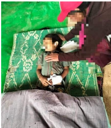
The unidentified child killed by Myanmar army shelling in Moebye on September 8

Thursday's battle reportedly started in Pwel Kone Ward 3, in the town of Moebye, which is located on the border with Karenni (Kayah) State.