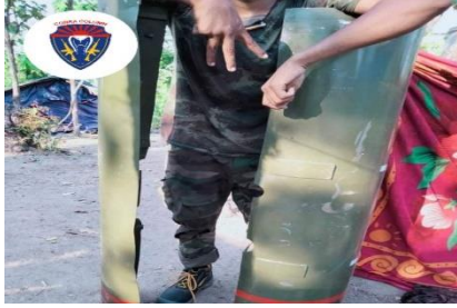
Pieces of a bomb dropped in Karen State in April (Cobra Column)