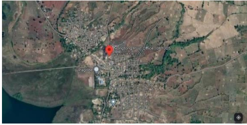
နောင်ထော်ကျေးရွာ

အဆိုပါ တိုက်ပွဲတွင် သေနတ်သံပစ်ခတ်ပြီး နောက်ပိုင်း စစ်ကောင်စီက လေယာဉ်ဖြင့် လာရောက်တိုက်ခိုက် ခဲ့ကြောင်း သိရသည်။