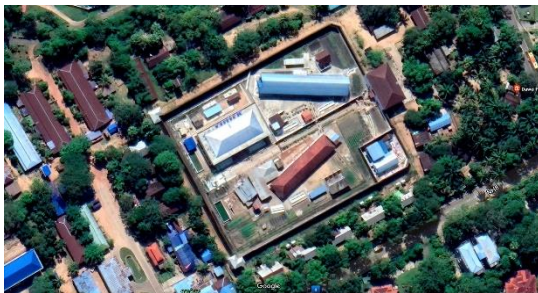
Google Earth မှ မြင်တွေ့ရသည့် ထားဝယ်အကျဉ်းထောင်

မြန်မာ့အမျိုးသမီးသမဂ္ဂ (BWU) က ထုတ်ပြန်ထားသည့် အချက်အလက်များအရ စစ်တပ်က အာဏာသိမ်းလိုက်သည့် ၂၀၂၁ ဖေဖော်ဝါရီ ၁ ရက်မှ ၂၀၂၂ ဇူလိုင် ၃၁ ရက်ထိ အမျိုးသမီး ၂၃၇၂ ဦး ဖမ်းဆီးထိန်းသိမ်းခံခဲ့ရပြီး စစ်ကောင်စီ လက်ချက်ကြောင့် အမျိုးသမီး ၂၄၁ ဦး သေဆုံးခဲ့ကြောင်း သိရသည်။