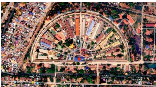
Google Earth မှ မြင်တွေ့ရသည့် အိုးဘိုအကျဉ်းထောင်